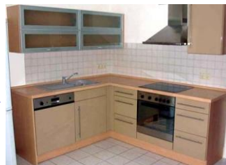
Küche mit Schublade für Produkte des täglichen Bedarfs.

Entnahme für täglichen Bedarf. „First in, first out“ für Lagerumschlag.