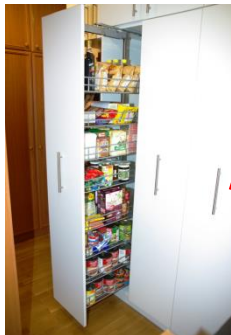
Vorratsschrank für 30 Tage

Erstbeschaffung und laufende Vorratergänzung